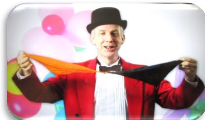
Magic English もありましたよ！